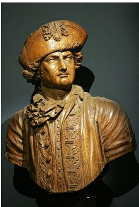
Foto: Adm Marquis A. Duquesne leidde de Franse vloot. Hij was een oud-leerling van Michiel.

Op 20 december kwam het eskader aan in de baai van Milazzo, op de noordoost punt van Sicilië. De onderkoning ter plaatse gaf de bemanningen tot hun grote vreugde een aantal ossen, vaarzen, schapen, hazen en suikerbroden. Op 1 januari ging het eskader weer anker op want de Franse vloot was nabij. Een week later begon men met de voorbereiding op de eerste zeeslag. De bakstafels werden aan het plafond vastgemaakt, de geschutspoorten geopend, voldoende munitie klaargelegd bij elk kanon en het vuur in het kombuis werd gedoofd. Toen vond de eerste zeeslag plaats, de slag bij Stromboli. Nu konden de mannen in praktijk brengen waar zij zo dikwijls voor hadden geoefend. Toen de twee admiraalsschepen elkaar dicht genoeg genaderd waren, opende de "Eendracht" het vuur met een salvo, direct gevolgd door een salvo vanuit het Franse schip.